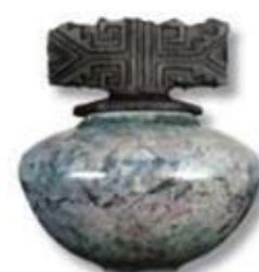
R-14 [O] Smokey Lilac