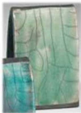
ZR 1923 Aqua Verde raku glasur Silkeblank grønn med rødlig luster effekt ved reduksjon.