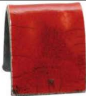
ZR 1935 - Rød raku glasur Silkeblank intensiv rød.