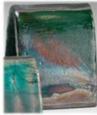
ZR 1925 - Atoll raku Silke matt mørkegrønn med rødlig bronse luster effekt.