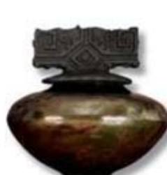
R-18 [TL] Lustrous Copper