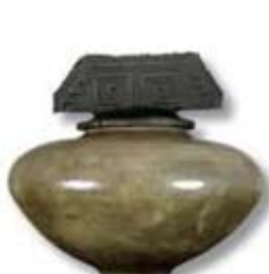
R-17 [O] Tarnished Silver