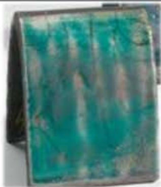
ZR 1924 - Adria Raku Silkeglinsende blågrønn med rødlig bronse effekt ved reduksjon.