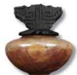
R-16 [O] Copper Patina