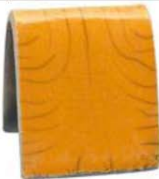
ZR 1937 - Gulorange raku glasur Silkeblank intensiv gulorange.