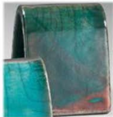
ZR 1927 - Esmeralda raku glasur. Halvblank mørk grønn med rødlig mot bronse farget luster.