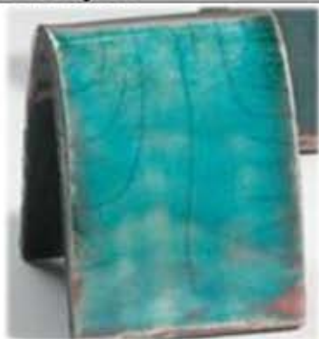
ZR 1926 - Bavaria raku Silkeblank turkis blå med rødlig mot bronse luster effekt ved reduksjon.