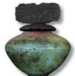
R-13 [O] Smokey Blue