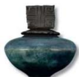
R-12 [O] Bluebell