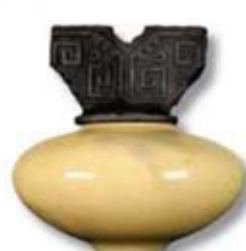
R-21 [TP] Yellow Crackle