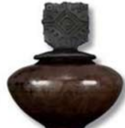
R-19 [O] Copper Matte

[O]=Opaque [TP]=Transparent [TL]=Translucent