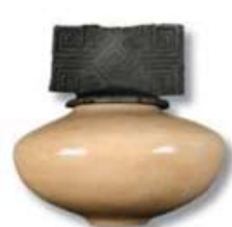
R-10 [TP] Clear Crackle