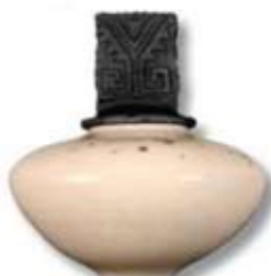
R-11 [TP] White Crackle