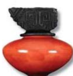
R-20 [TP] Red Crackle