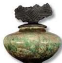
R-15 [O] Caribbean Blue