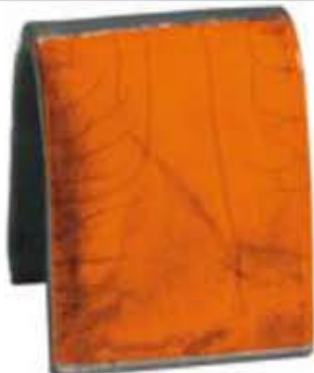
ZR 1936 - Orange raku glasur Silkeblank intensiv orange.